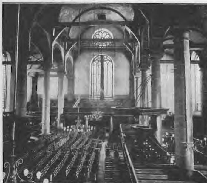
De kerk van binnen, naar 't Zuiden gezien

Twee rijen elk van vijf zandsteenpilaren in Dorische stijl scheiden het middenvak van de beide zijgedeelten. Verder zijn langs de muren aangebracht twaalf halfronde en vijf kwartronde kolommen. De kerk heeft vier ingangen, namelijk twee in de Zandstraat, één in de Zanddwaarsstraat en één in de Sint Antoniesbreestraat. Deze laatste was vroeger ook de ingang tot het Zuiderkerkhof, waar in de schaduw van het massale bouwwerk het gebeente rust van velen. In 1844 werd er nog begraven en pas in 1866 werd het kerkhof gesloten verklaard. Een fraai poortje (in de oorlogsjaren opgeborgen) in de Breestraat gaf toegang naar het kerkhof. Het wordt toegeschreven aan Nicholas Stone, een Engelse leerling, later schoonzoon van Hendrick de Keyser. Ook vindt men op het vroegere kerkhof de grafkelder der familie Hartman, gebouwd in 1678 en versierd met wit marmeren geslachtswapens. Dit schijnt een der weinige praalgraven buiten de kerken te zijn uit die tijd, en is daarom op zichzelf al merkwaardig. Ook in het kerkgebouw is begraven. De vloer bestaat namelijk uit 552 hardstenen zerken en onder één ervan, bij de ingang van het vertrek van de kerkmeesters, rust het gebeente van de geniale bouwheer Hendrick de Keyser. Boven zijn steen heeft in 1921 de vereniging, die hem tot schutspatroom koos, ter herdenking van zijn sterven juist driehonderd jaar geleden, een plaat ingemetseld met het vers van Vondel: