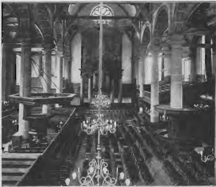
De kerk van binnen, naar 't Noorden gezien