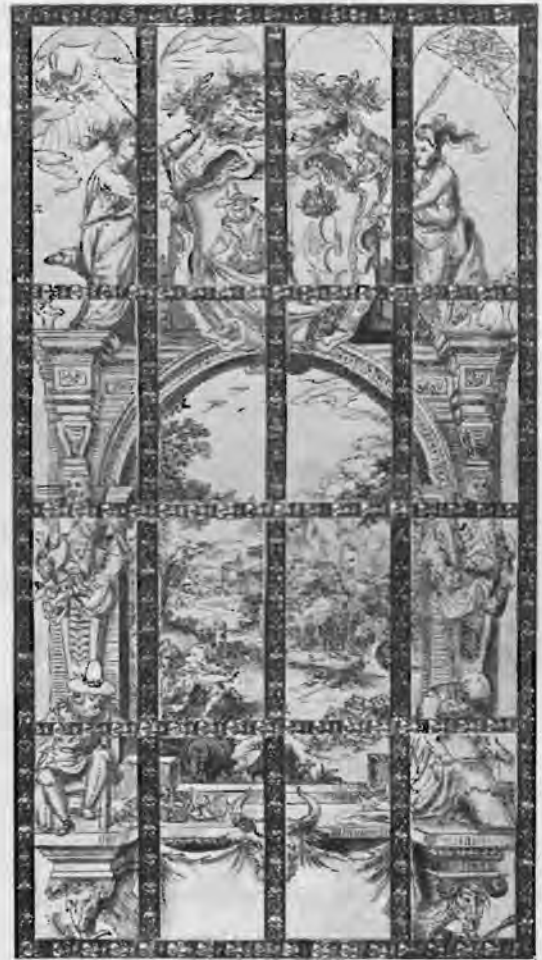
De nadering van Mozes tot het brandende braambos

Een stuk Amsterdamse kerkhistorie was afgesloten.