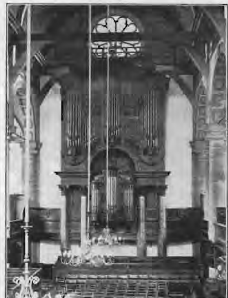
Het orgel in de kerk