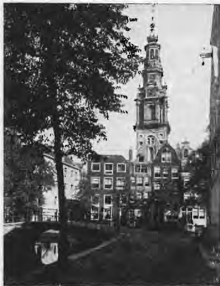
De Zuiderkerkstoren vanaf de Groenburgwal

Ongetwijfeld moet er op het einde der zestiende eeuw bij de Hervormden te Amsterdam een bloeiend kerkelijk leven hebben geheerst. De stad, die in 1595 ongeveer 50.000 zielen telde, had vier grote kerken, benevens de Gasthuiskerk, bestemd voor de Hervormde eredienst, en zeven predikanten waren aan de gemeente verbonden.