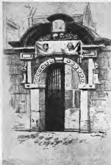
Het poortje van het Zuiderkerkhof in de Sint Antoniesbreestraat. (Naar een ets van C. L. Dake)