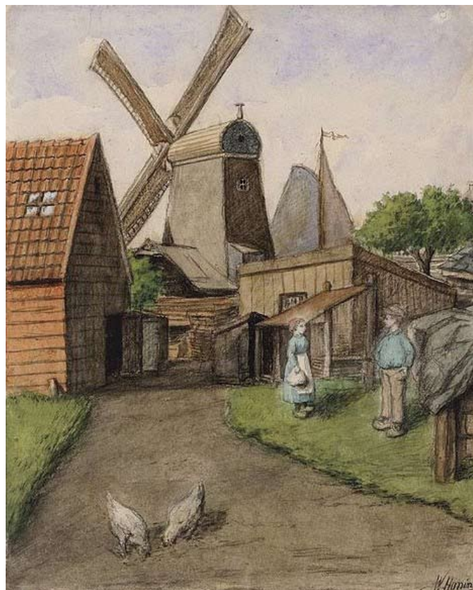
Boven: De Achterweg met paltrok-molen De Eenhoorn. Het zeilschip er achter vaart in de Kostverlorenvaart.