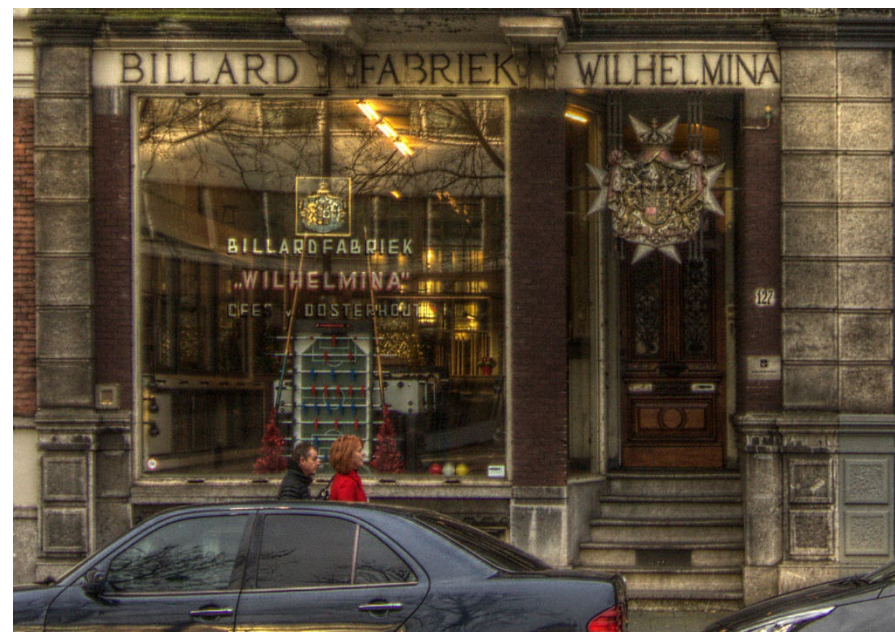
Billardfabriek " Wilhelmina " op de Stadhouderskade 127