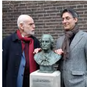
Musicus Ton Koopman en beeldhouwer Fabio Pravisani

https://www.youtube.com/watch?v=OX-FFWz9Dm4&list=RDOX-FFWz9Dm4&start_radio=1