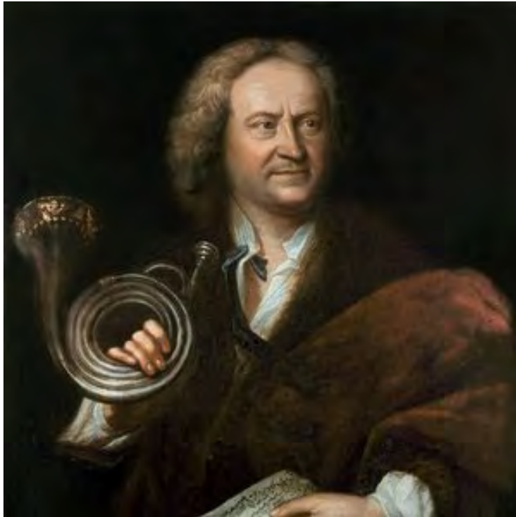
Maestro Pietro Antonio Locatelli 🎵🎵

Componist / Violist / Amsterdammer Pietro Locatelli (Bergamo 1695 – Amsterdam 1764)