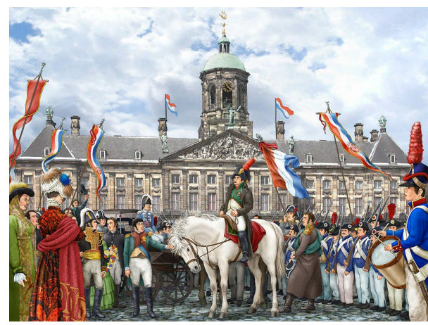
Napoleon bij het 'Keizerlijk Paleis' op de Dam