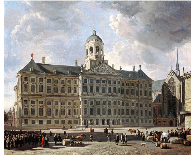
Schilderij van 't 'Paleis op de Dam' – 1670, Gerrit Adriaensz. Berckheyde

zie: https://historiek.net/paleis-op-de-dam-in-2020-weer-stadhuys/6536/