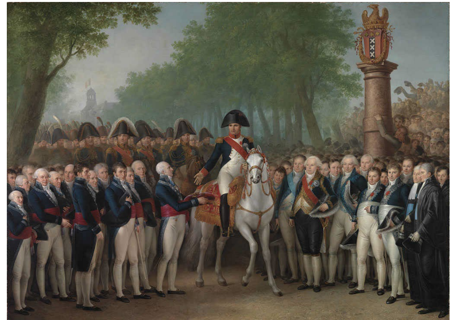
Mattheus Ignatius van Bree: 'De intocht van Napoleon te Amsterdam op 9 oktober 1811'

Zie ook: https://nl.wikipedia.org/wiki/Oranje-Nassau_Kazerne