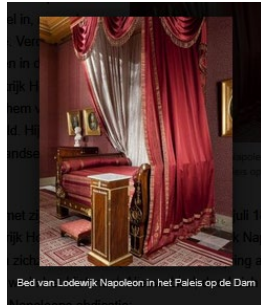
Volksherseling Lodewijk Napoleon. Rechts zijn bed.

https://historiek.net/lodewijk-napoleon-koning-holland-konijn/75255/