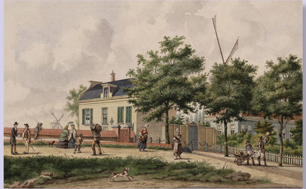
▲ Dalrust en Flora 1861