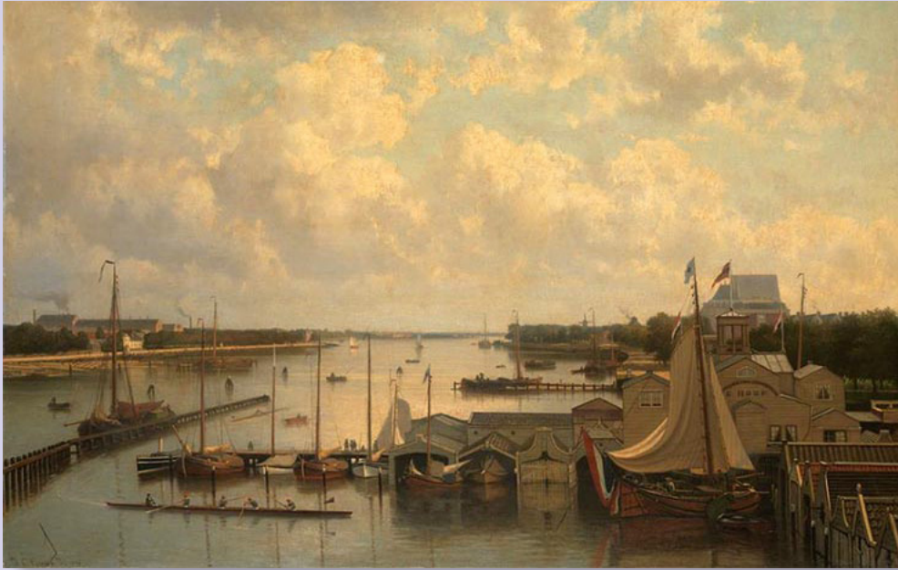
▲ Amsteljachthaven 1875