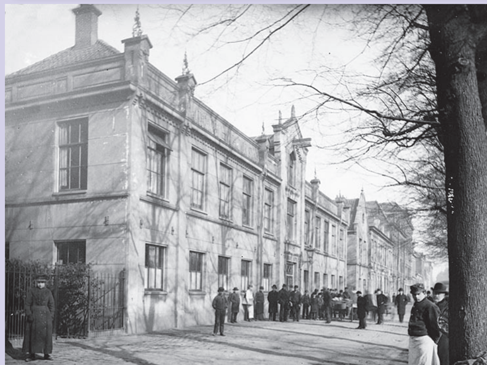
▶ ...na de verbouwing van 1877