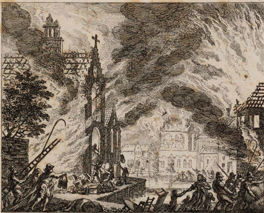
Felle brand te Amsterdam, 1452.

Aan de oude zijde werden alle kloosters het slachtoffer van het vuur, 14 in totaal. Thomas á Kempis deed vanuit Zwolle verslag hoe het met de kloosters in Amsterdam na de brand gesteld was. De zusters liepen ontredderd door de stad, bedelend om onderdak en voedsel. Voor het Minderbroedersklooster betekende het 't einde; het stond tien jaar leeg voordat een andere tak van de Franciscaner orde, dit keer Observanten, de draad weer oppakten. De deels reeds versteende St. Anthoniespoort werd zozeer aangetast door het vuur dat tijdens de versterking van de stadsmuur het poortgebouw een