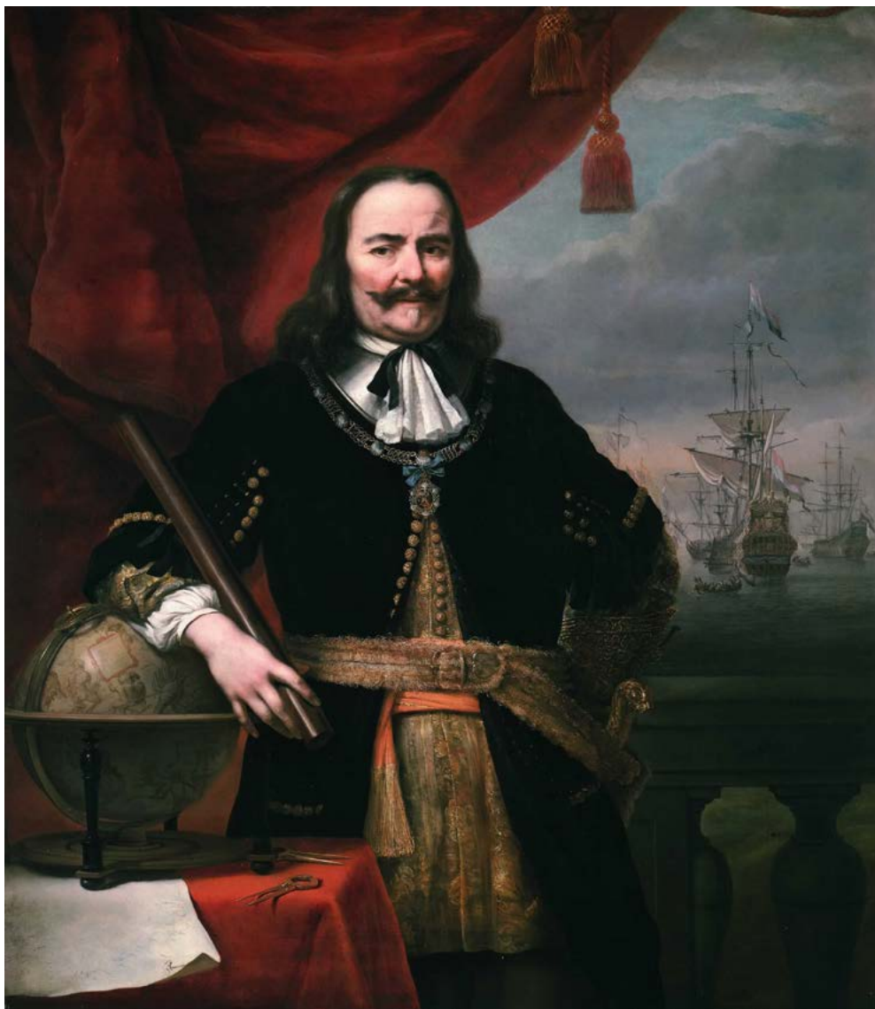
Boven: Het portret van Michiel de Ruyter dat Ferdinand Bol in 1667 schilderde en waarvan in Zeemanshoop een kopie hing.