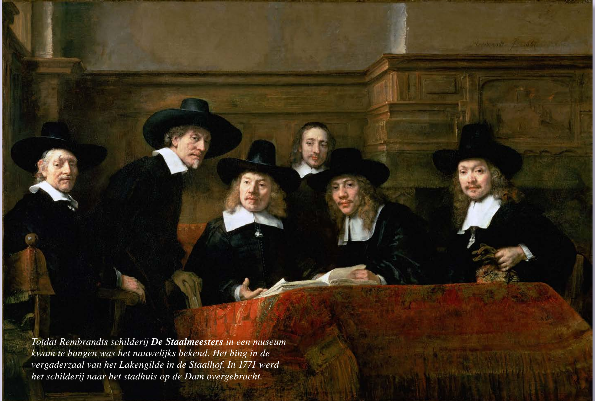
Totdat Rembrandts schilderij De Staalmeesters in een museum kwam te hangen was het nauwelijks bekend. Het hing in de vergaderzaal van het Lakengilde in de Staalhof. In 1771 werd het schilderij naar het stadhuis op de Dam overgebracht.