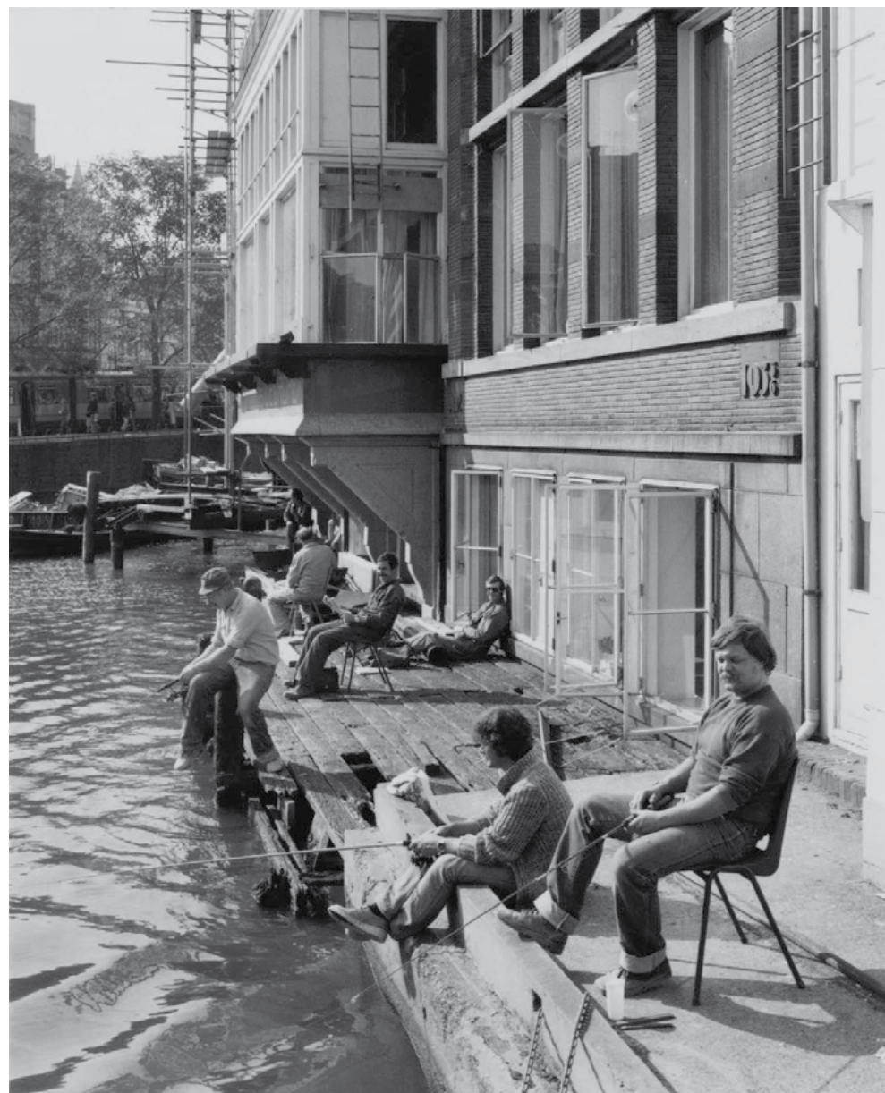
Boven: De vissteiger! Achter die openstaande ramen was mijn vaders fotozaak. Links: Opa en oma in het zonnetje, ongetwijfeld tijdens een jubileumsviering