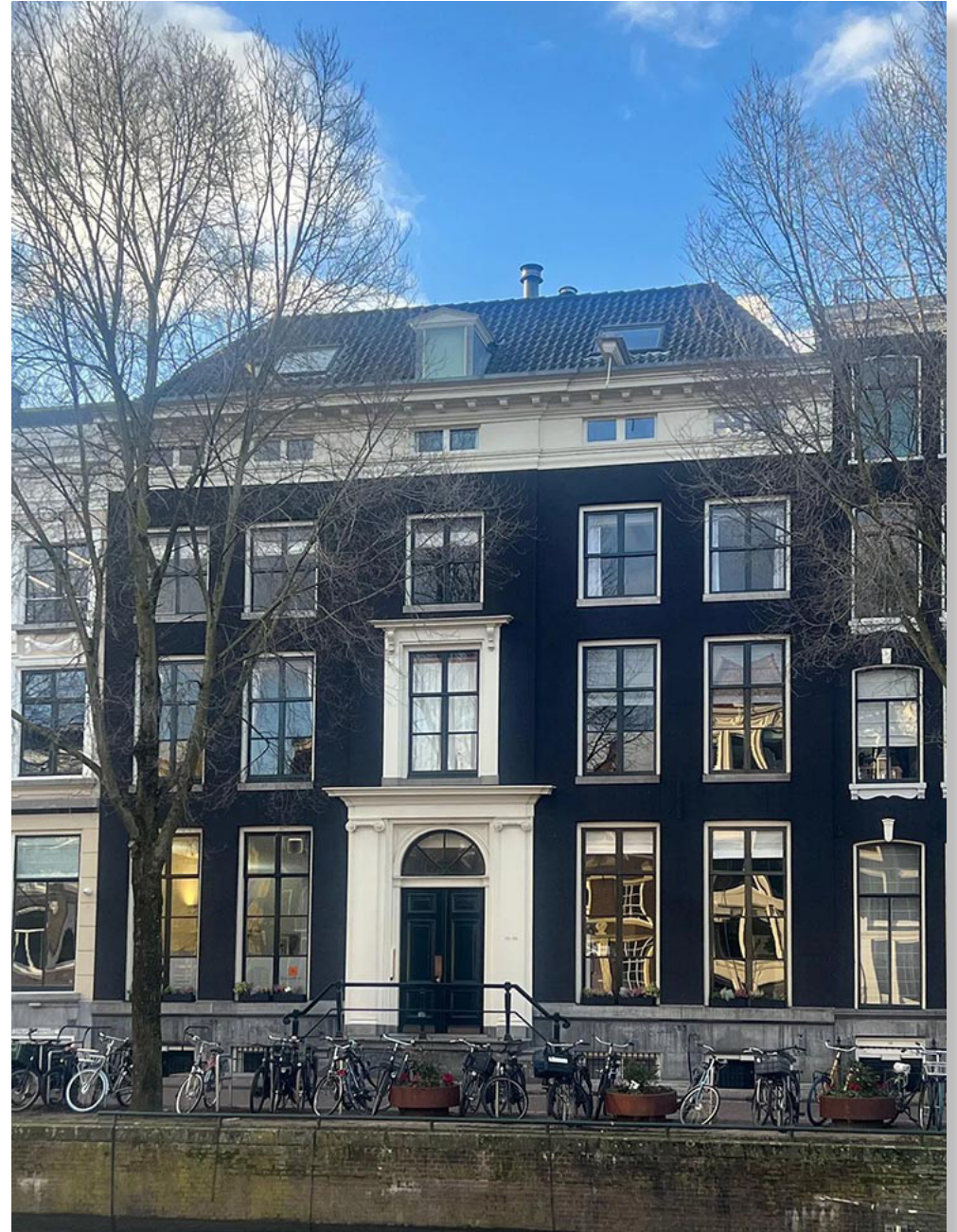
▶ Herengracht 52 na de verbouwing