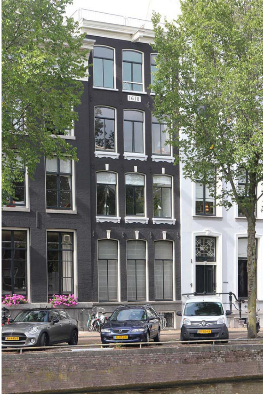
◀ Herengracht 50 nadat het pand ingelijfd was bij nr.52 en zowel de stoep als de complete entree was kwijtgeraakt