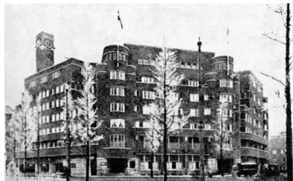
Het Nieuwe Huis, Roelof Hartplein, exterieur en plattegrond (hieraan)

Vergeleken bij onze huidige maatstaven lijken de woningen van De Dageraad in genoemd complex vrij klein en oncomfortabel. Men moet echter wel bedenken dat de nieuwe huizen een belangrijke verbetering vormden in de leefsituatie van de arbeiders. Dit geldt in het bijzonder voor De Dageraad. Het complex gold in die tijd niet voor niets als bolwerk van het socialisme!