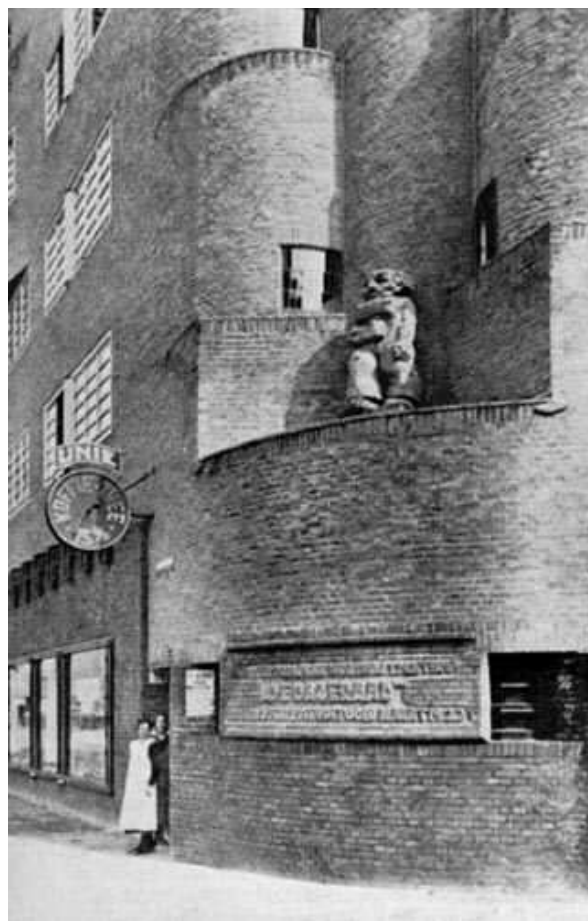
Woningbouwvereniging 'De Dageraad', hoek Pieter Lodewijk Takstraat/ Burgemeester Tellegenstraat

Amsterdam. Hier was de 'macht' in die tijd namelijk in handen van genoemde groepering.