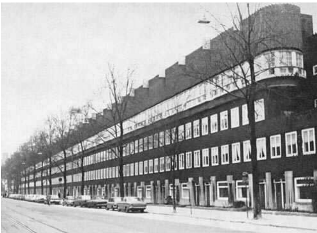
Hoofdweg, door H.Th. Wijdeveld, 1925

nadruk komt te liggen op de horizontale lijnen. Mede hierdoor krijgen deze woningen een heel ander karakter dan de volkswoningbouw vóór die tijd, zoals de huizen in de Pijp. Een decoratief effect wordt bereikt door de toepassing van verschillende vormen en kleuren baksteen, sierverbanden, diepe voegen, profileringen en verspringingen. Bij platte daken wordt de daklijn geaccentueerd; pannendaken zijn vaak zó steil dat zij een verlengstuk van de gevel vormen. Bij een nauwkeuriger speurtocht door Amsterdam blijkt in grote delen, gebouwd tussen circa 1915 en 1930, het voorbeeld van De Klerk en Kramer te zijn gevolgd, wat karakter, algehele vormgeving en/of detaillering betreft. Andere architecten voegen daar weer nieuwe kenmerken aan tot, zonder zich van dezelfde stijl los te maken. Zo wordt het beeld van de Amsterdamse School steeds veelomvattender en worden haar grenslijnen steeds vager.