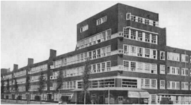
Hoofdweg hoek Postjesweg, door P. Kramer, 1923

In 1913 wordt aan de Prins Hendrikkade begonnen met de bouw van het Scheepvaarthuis. Dit in 1916 voltooide gebouw is in verschillende opzichten uniek. Toch wordt het door velen gezien als de gangmaker van een architectuurstijl, die zich in eerste instantie laat kenmerken door veel en kleur-rijk baksteengebruik, een expressieve en plastische vormgeving, rijke schaduwwerking en een vrij overvloedige decoratie. Deze stijl krijgt al gauw de benaming Amsterdamse School, omdat zij bij uitstek een Amsterdamse aangelegenheid is. De term werd voor het eerst gebruikt in 1916, door architect Jan Gramata in een artikel over Berlage. Als men nu nagaat wat er allemaal in Amsterdam en ook daar buiten met meer of minder grote zekerheid onder de noemer Amsterdamse School gebracht kan worden, dan is het duidelijk dat het boven gegeven beeld veel te ongenueanceerd is.