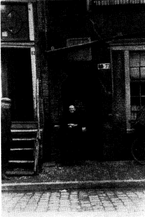
De Hoeksteensgang omstreeks 19 10.

gebouw zien we verdeeld in drie vóór- en vijf achterwoninkjes, resp. genummerd 7 5, 77, 79, en 6 5, 67, 69, 7 1, 73. Zij begrenzen elkaar ruggelings en zijn slechts gescheiden door een gemeenschappelijke tussenmuur. Bijgevolg moesten de vóórbewoners hun licht scheppen alleen uit de smalle en sombere straat. In dit opzicht waren de achterburen er beter aan toe. Zij keken uit op het zuiden en hadden vóór zich een vrij brede, ledige ruimte. Waar zij ook gebrek aan hadden, niet aan zonneschijn. De Hoeksteensgang staat er fors getekend, juist in het verlengde van de Gapersgang op de Looiersgracht. Voor wie de dwarsstraat wilde vermijden, bestond er dus zoiets als een geheime verbinding tussen de straat en de gracht.