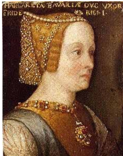
Links: Margaretha, gravin van Holland, Zeeland en Henegouwen 1345-'54

De 13 e -14 e eeuw is de periode dat de steden zich gaan manifesteren en zich ontwikkelen tot autonome kernen die niet veel met adel en