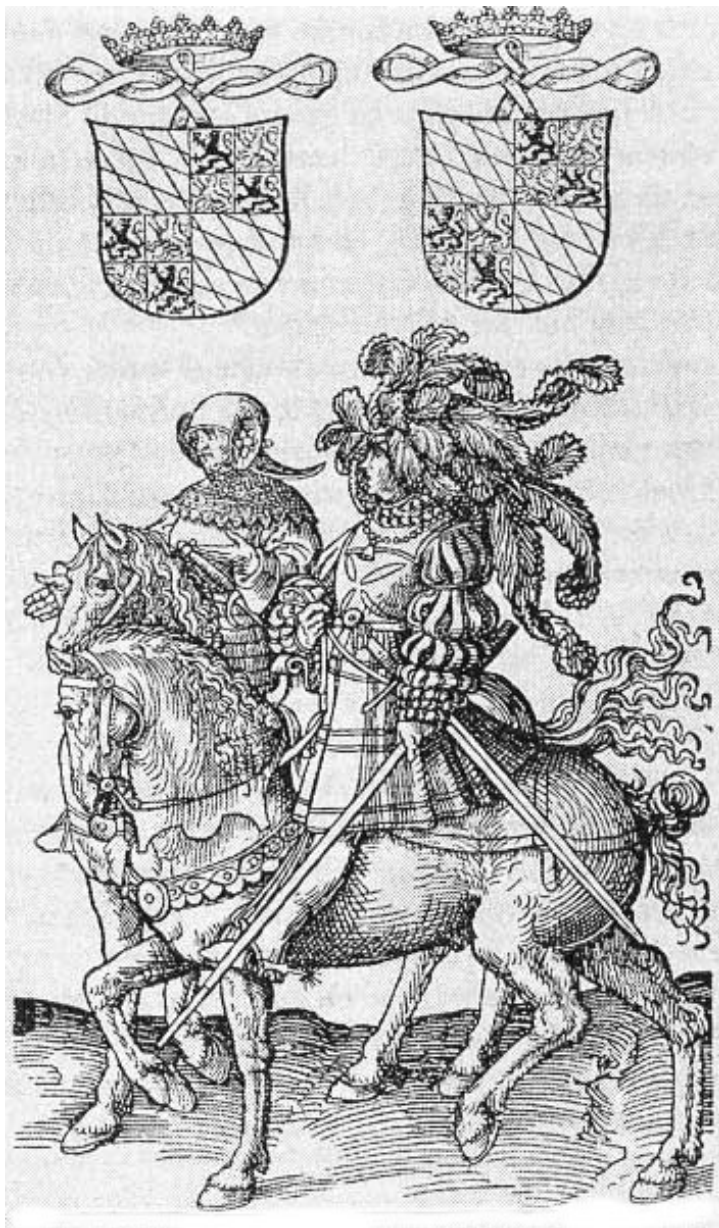
Graaf Willem V en zijn broer Albrecht, die in 1358 regent werd na het krankzinnig verklaren van Willem.

politiek geworden. Nadat Jan van Beieren kinderloos stierf kwam het Beierse huis door erfopvolging in handen van Bourgondië. Dat streefde centralisatie en autocratie na en dat ging ten koste van de privileges van de adel. De steden waren, met hun welgevulde beurs, de lievelingen van de Bourgondische hertogen.