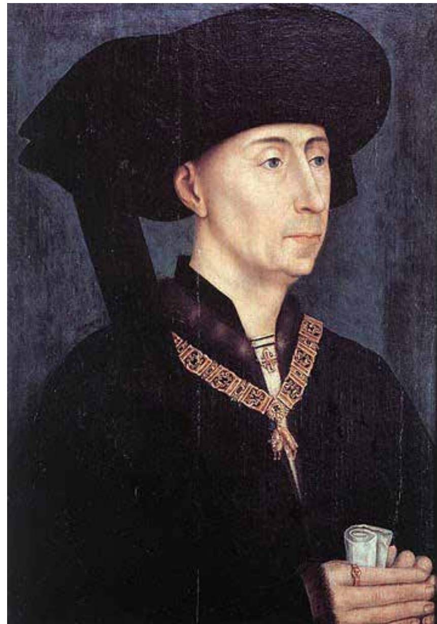
Filips de Goede, hertog van Bourgondië en graaf van Holland en Zeeland - 1433-1467.

Bij twee tegengestelde belangen hoorden ook twee partijen, die de geschiedschrijvers voor het gemak nog steeds Hoeken en Kabeljauwen noemen. De Hoeken vertegenwoordigden in dit machtsspel de belangen van de adel tégen de Bourgondiërs en de Kabeljauwen die der steden vóór de Bourgondiërs en tegen