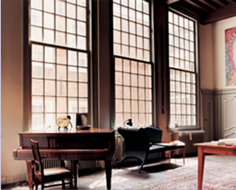
Links: Recente interieur- foto van Koestraat 10, de voormalige gildezaal in het achterhuis