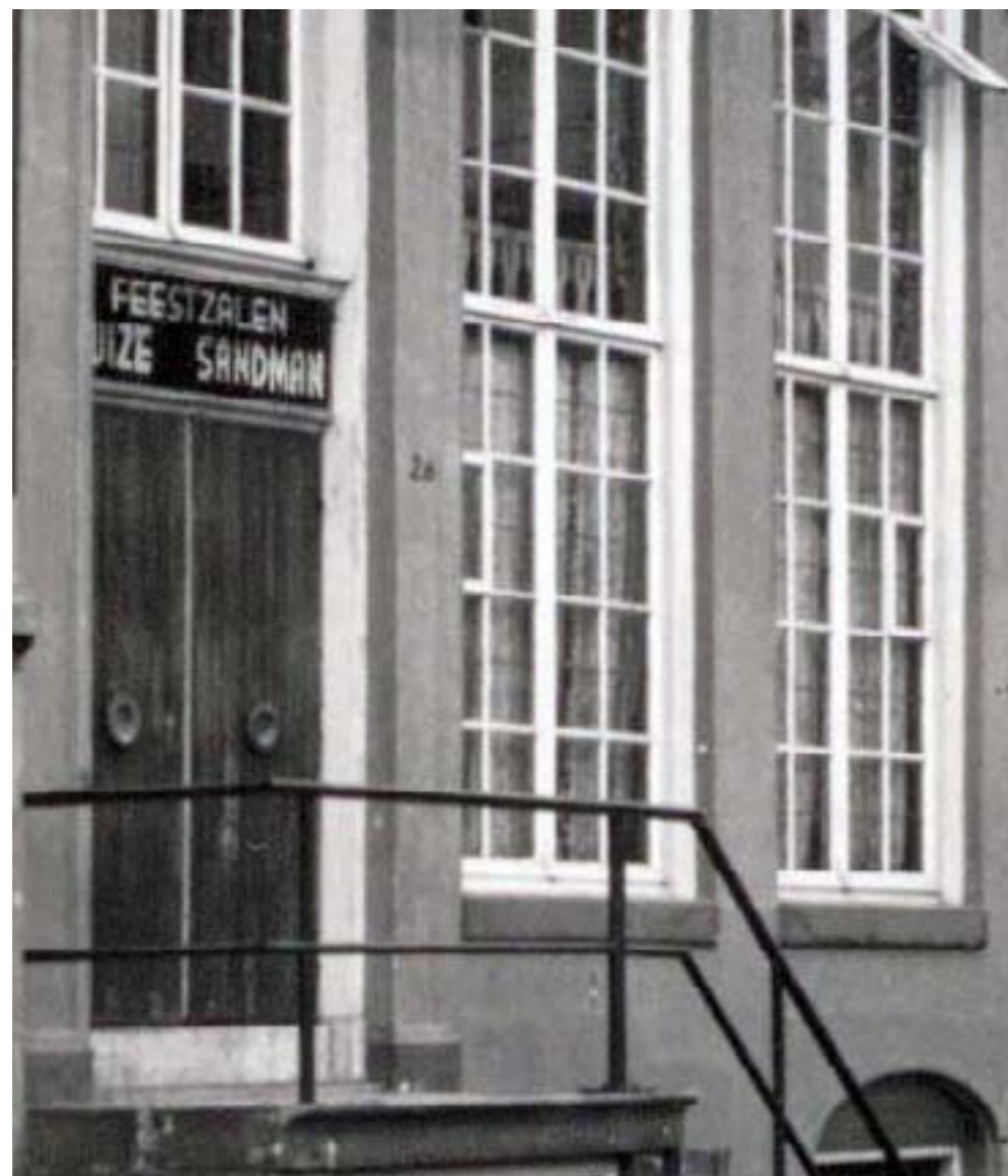
Boven: Een foto van Zwanenburgerstraat 26 van kort na de oorlog: Feestzalen Huize Sandman, zonder de wel erg Duitse dubbele 'nn'. Later vond men dat wel weer kunnen en werd de 'n' weer toegevoegd (zie pag. 10).