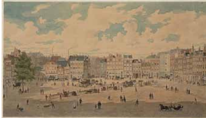
De boeken- en prentenmarkt, zoals die enkele dagen p/week gehouden werd

de Botermarkt te dezer stede een eigenaardig stempel drukte. Immers in een schuine lijn, in de richting van de Halvemaansteeg naar de Utrechtsche straat, strekten zich over het midden van het plein twee lange aaneengesloten rijen van met het front naar elkander gekeerde stallen met oude boeken uit, en iets van dien aard vond men in geen stad van ons land of van het buitenland. De eigenaars dier stallen waren op enkelen na Joden, en de voornaamsten van hen woonden ook aan het plein: Penha aan de zuidzijde dicht bij de Utrechtsche straat, Smit in den hoek der westzijde bij de Bakkerstraat, Lobo, bij wien Multatuli eenigen tijd inwoonde, aan de oostzijde bij de Reguliers dwarsstraat. Zij waren aan elkaar verwant, en zooals zij den driehoek op het plein vormden, beheerschten zij de boekenmarkt. Daar kon de student, die geld noodig had, zijn zooveel uit den winkel gekochte boeken te gelde maken, daar vond menig jongmensch, die inderdaad studeerde, dikwerf voor een kleinen prijs een bron van wetenschap; want die eenvoudige kooplieden hadden achtung voor hun boeken en voor hen, van wie zij wisten, dat zij die met belangstelling gebruikten. Uit geheel Holland kwamen de boeken- en prentenverzamelaars en honderden uit den vreemde naar de Botermarkt te Amsterdam; de bouquinistes in Parijs of Londen stonden bij die hier