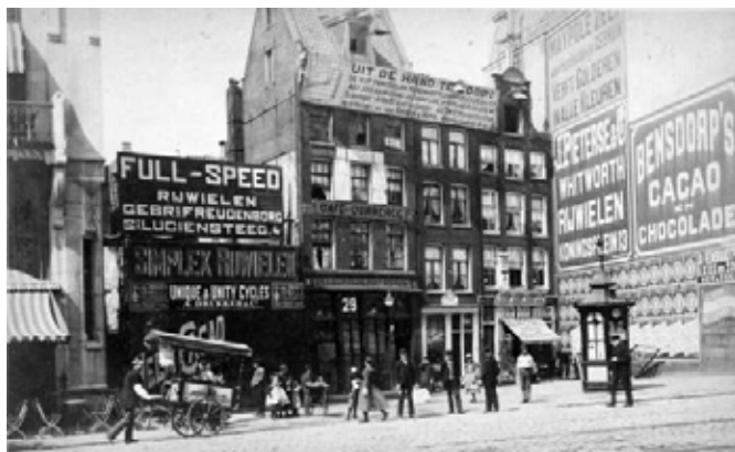
De gevelwand die gesloopt is voor de bouw van het Rembrandttheater

niet te A. , is een afgeluisterd gesprek tusschen een apotheker en een tapper, in Augustus 1849, waarin de eerstgenoemde het wint op zijn tegenstander, dat voor dit jaar de kermis niet moet doorgaan. Reeds van 1709 is de Rarekiek , verder een Physiologie der Amsterdamsche Kermis, Wandelaars en Wandelingen , een reeks polemische geschriften voor en tegen de kermis, het Reisje van een Hagenaar naar de Amsterdamsche kermis . Nog waren er De Hollandsche Faam vliegende over de Amsterdamsche kermis en de Veilingskranten van kermis-