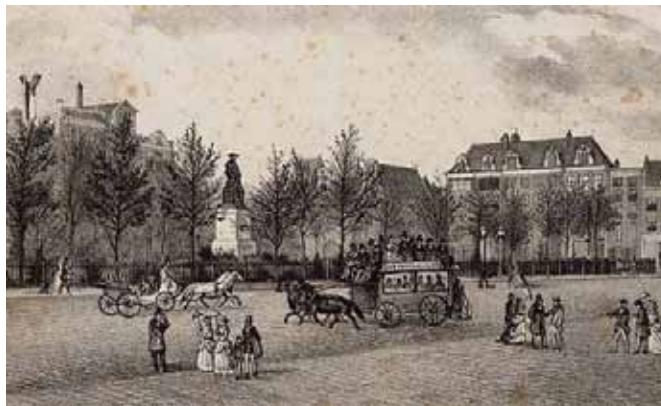
Het Rembrandtplein met het verplaatste Rembrandt-monument

zelfde redenen leidden ook in 1854 tot verwerping van eenzelfde voorstel, toen gedaan door Baron van Tuyll van Serooskerken, die als voorwaarde stelde afstand van den schouwburg op het Leidscheplein. Wel werd ook deze zaak een oogenblik aangehouden, maar om ten slotte het lot der andere te deelen. Langen tijd was het beeld van Rembrandt een der weinige standbeelden in de hoofdstad des lands, en met beide handen werd dus in 1875 het verzoek der commissie aangenomen, die zich had gevormd om voor den grooten liberalen staatsman Thorbecke een gedenkteeken op te richten. In den gemeenteraad kwam een adres in van de Maatschappij Arti et Amicitiae om het beeld van Rembrandt naar de Weteringschans over te brengen, maar in een geheime zitting werd besloten aan het nieuwe beeld de plaats te geven op het Reguliersplein, waar dat van den schilder stond, en dit te plaatsen in het midden der Botermarkt. Zoo sympathiek als de daad van het Thorbecke-comité was, dat zijn archief en het hoofd van het door den beeldhouwer Leenhoff vervaardigde mode& waarnaar het beeld werd gegoten, aan de stad afstond, zoo weinig waardeering toonde het groote publiek, en bij de onthulling in 1876 ging het alles behalve rustig toe.