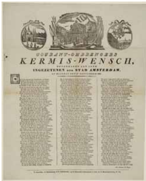
Een Aschmannen-kermiswens uit 1833

Zoo kreeg men elk jaar een nieuwen heilwensch, in 't eerst op wit, later ook op getint papier en met tekening in zwart, zeer zelden in andere kleuren van een of ander gebouw of plek in de gemeente, van den torenwachter, den nachtwacht, lantaarnopsteker, vuilniskarreman enz. Zelfs