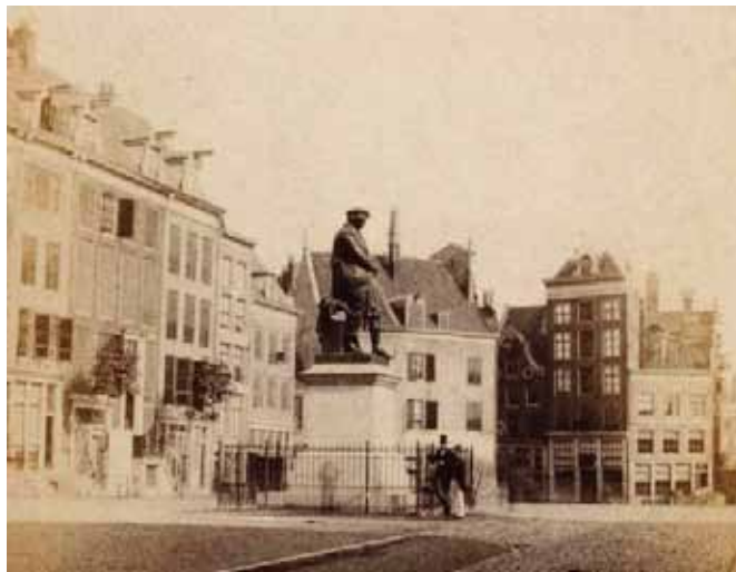
Het Thorbeckeplein op een foto uit 1860, gezien naar Reguliersbreestraat

Maar lang niet alle perceelen werden bij overgang door een cijfer of door eenige nadere aanwijzing van ligging aangeduid; het uithangteeken of een spreuk was voldoende aanwijzing. Niemand verwisselde het huis en erf, gelegen aan de Reguliersmarkt tusschen de Wagenstraat en Paardenstraat, daar de Jonge Prins in den gevel staat, met een ander perceel. Wie