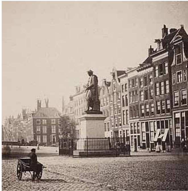
De gedempte Reguliersgracht, hier in 1864, werd Kaasplein.

stelveld konden 82 kramen staan van 13 l lang en 7 l breed en 16 poffertjeskramen van 16 l x 12 l . Op de Nieuwe Markt konden 243 kramen staan van 14 l lang en 7 l breed of diep. Op den