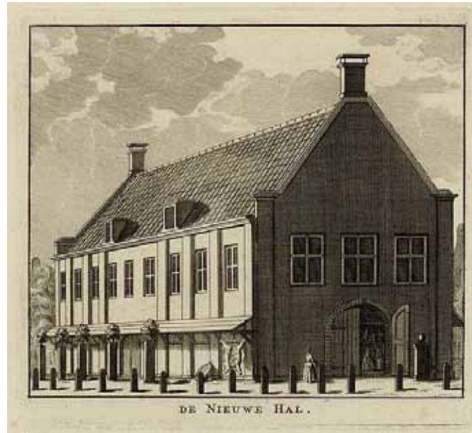
De in 1737 gebouwde vleeshal op de Botermarkt gebouwde vleeshal

heien van 185 masten, eenige min of meer, tot fundament van een nieuwe hal op de Botermarkt aanbesteed en ook twee steenen blauwe pompen aan de nieuwe hal aldaar gemaakt. Vermoedelijk voldeed dat water niet. Want in 1785 wilde het stadsbestuur op de Botermarkt een nieuwe put doen boren om te onderzoeken of men geen zuiver zoet water, gelijk daar ter plaatse in een huis zeer goed gevonden werd, zou kunnen ontdekken. Maar orde moest er blijven op het fraaie plein, en het verzoek van den vleeschhouwer Paulus Hofman om bij die vleeschhal een balie te mogen opstellen om de beesten aan vast te maken werd afgeslagen. Hij kon dat immers op zijn eigen erf of op de ossenmarkt doen. Het slagersgild was ook niet meegaand. In 1802 moest aan ossenslagers, die zich aan sluikerij of brutaliteit schuldig maakten, de bank en de hal voor een tijd of voor goed