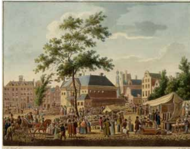
Jaarmarkt op de Botermarkt, die soms drie weken duurde.