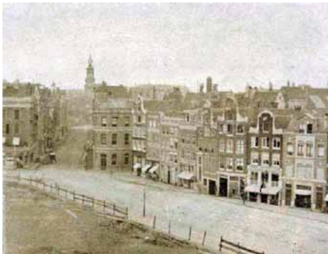
De gevelwand a/d noordzijde van de Botermarkt, na de sloop van de waag