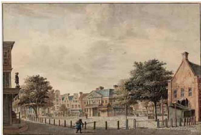
De Botermarkt, gezien vanaf de Utrechtsestraat. Rechts de vleeshal.

dat zelfs de landgenooten hier niets invoerden, bewijst de vermaning van 24 Juli 1669 aan de marktmeesters om beter te zorgen voor het handhaven der keuren en ordinantiën. Daar de boter een belangrijke bron van inkomsten was, hielden zoowel het bestuur als de burgerij aan de keuren vast. Want niettegenstaande de keuren van 1672 en de amptiatie van 3 675, weer afgekondigd in 1682, verkochten verscheidene vreemde personen, komende van Embden, Groningen en elders uit Vriesland en Overijssel, dagelijks buiten de marktdagen hun boter en zuivel in en voor hun schepen op de wallen, zoo op het Water, in de Oude Teertuinen, bij de Spaarndammerbrug en elders; zij lieten door kruiers en loopers door de stad venten, ontweken dus de gerechtigheden en benadeelden de ingezetenen kooplieden. Er werd dus wederom bepaald, dat die ter bepaalde