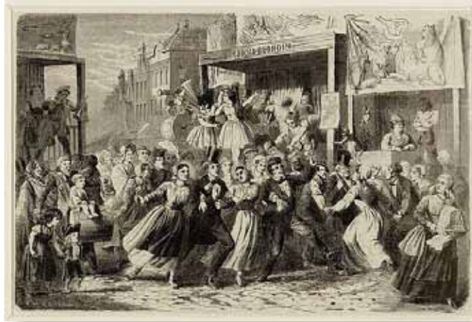
Hossende menigte op de jaarmarkt.

scheperen met tentoonstellingen tien penningen per week. Maar in 1839 waren de bedragen veel hooger, en het laat zich denken dat het stedelijk bestuur die bron van inkomsten ongaarne miste. De markt- of grondhuur was toen tot tien vierkante Nederlandsche ellen 25 cts. per vierkante Nederlandsche el, tot en met 25 el 30 cts., van 25 tot 50 el 40 cts., van 50 tot 75 el 50 cts., boven 75 el 60 cts. per vierkante el. Draaimolens moesten f 10, koekhakblokken f 1,50, handkarren en overdekte zuurwagens per stuk 60 cts., gewone kruiwagens met marktgoederen en zulke voorwerpen 40 cts. opbrengen. Van scheperen met vertooningen werd een watergeld van 10 cts. per sloop van den inhoud geheven, berekend volgens den rijksmeetbrief, die aan boord moest zijn. Zij echter, die het geheele jaar ter markt mochten staan, zouden gedurende de jaarmarkten hetzelfde als op de weekmarkten blijven betalen. Maar het marktgeld van de tenten en spellen met vertooningen moest voor het begin der tweede week van de jaarmarkt voldaan zijn. Ook de opbrengst der boeten was niet onbetekenend. Tenten, spellen, loodsens, kramen enz. moesten te twee ure na middernacht gesloten zijn op straffe eener boete van f 5 tot f 25 en algeheele sluiting voor het overige