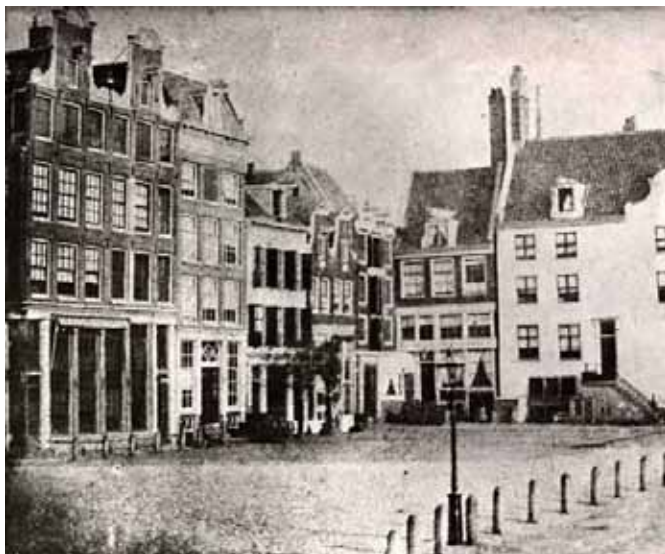
De Kippenhoek op de Botermarkt op een foto van rond 1860

Goedkoopster waren de perceelen 47 tot en met 50 aan de oostzijde der Reguliersmarkt gelegen, zij brachten in die jaren van 1200 tot 2000 gulden op; en bij no. 50 stelden zich twee makelaars borg voor Willem Segerts Verbroeck, houtkoopster in de Oranjespruit in de Houttuinen. Het goedkoopst waren echter de perceelen 1 tot en met 4, aan de westzijde der Reguliersmarkt gelegen, en wel no. 1 was een hoekerf aan het einde van een driehoekje, no. 4 lag op den hoek der Reguliersdwarstraat. De prijzen dezer erven waren 14, 15 en 1600 gulden. Zestig jaren later was nog de Reguliers- of Botermarkt als woonplaats door deftige heden gezocht. Andries van Boon kocht er name-