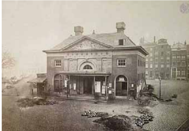
De boterwaag vlak voor de sloop in 1874.

De verandering in den politieken toestand verbeterde dien der boterhandelaars, maar niettemin maakte het gemeentebestuur het zuivelbedrijf tot een bron van inkomsten. Toen in 1833 in de stadskas een tekort was van f 212.000 begon men dat aan te zuiveren door alvast de boter met zeven cent per pond te belasten. Het verzet der kooplieden was vruchteloos, integendeel werd nog een paar maal de boter met tien cents per pond belast, en de marktgelden verhoogd, ook voor de kaasmarkt, omdat die belasting slechts de gegoeden drukte en de mindere klassen reeds toen geen boter, maar vet en reuzel gebruikten. De kaasmarkt nam daarentegen zoo toe, dat in 1852 besloten werd een kaasmarkt op de Botermarkt te houden, en dat het waaggebouw verbeterd moest worden. Op de begrooting van 1860 bedraagt de post van de belasting op de boter f 230.000. Na 1862 was reeds de kaasmarkt naar het Reguliersplein overgebracht, en de boter op de Botermarkt zelf gehouden, de belasting werd sedert niet meer verhoogd en in 1865 alle stedelijke accijnzen afgeschaft; de ambtenaren voor het stedelijk onderzoek en die voor de heffing der belasting werden ontslagen. Reeds vroeger waren er meermaalen ook in den Raad stem-