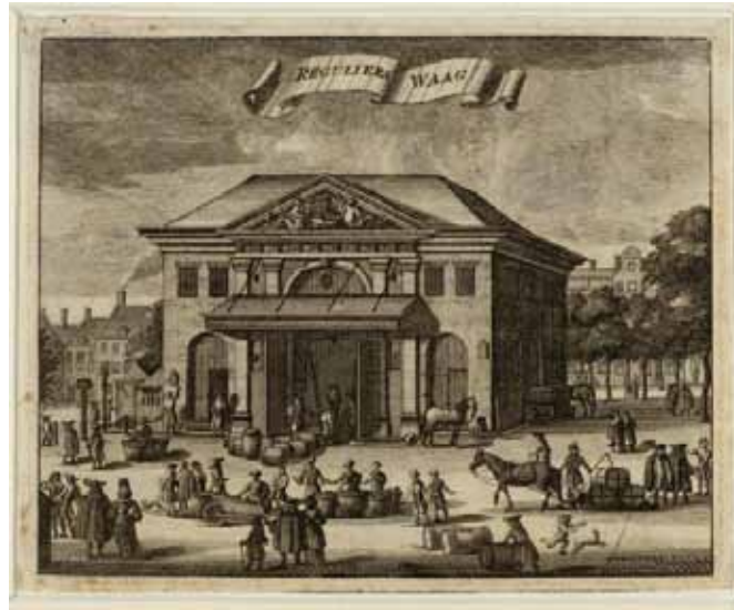
De Regulierswaag op de Botermarkt, de situatie tot 1693

voorstaan op den Dam aan de Waage ter plaatse, daar zij gewoon zijn". Het is dus duidelijk, dat vooreerst op den Dam de groothandel, op de Reguliers- of Botermarkt de verkoop in het klein plaats vond. Het is jammer, dat er geen cijfers van