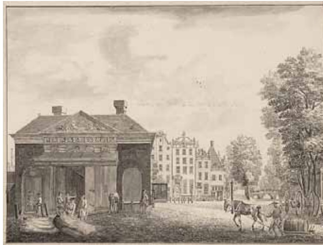
Het eerste deel van de Reguliersgracht werd in 1693-94 gedempt.

Wanorde en willekeur liet het stadsbestuur op het fraaie plein volstrekt niet toe. Het was verboden om met de waren, die op de Reguliersmarkt gekeurd waren, anders voor te staan dan binnen de palen en respectieve kwartieren, die op order van de Heeren Burgemeesters door den marktmeester waren aangewezen, op boete van drie gulden. Ook was het verboden de boomen aldaar staande te behangen, te bezetten of anderszins met scheuren, breken .of aanbinden te mishandelen, alsmede op dezelfde markt te kaatsen met den bal en te slaan met de elle op gelijke boete als voren; een verbod, dat ook op andere marktplainen van kracht was, zoowel voor de smouse- als voor de christenjongens. Blijkbaar wilde men de aan het plein wonende burgers voor allen overlast, die een markt meebrengt, vrijwaren. Die zorg blijkt nog uit een verbod van 26 Januari 1682, op klachten van de huizen aan de westzijde van de Botermarkt uitgevaardigd, tegen het werpen van vuilnis, paardenmest em., omtrent