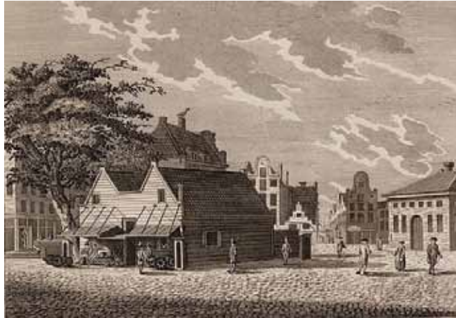
De Hoofdwacht op de Botermarkt in 1788, rechts de waag.

Intusschen was de Botermarkt van aanzien veranderd; in 1785 was namelijk de Reguliersgracht gedempt, een plein geworden, met moppen bestraat en rondom met steenen palen en ijzeren koppels afgesloten, en in het vervolg op J. Wagenaar's Amsterdam , uit het jaar 1792, lezen wij, dat na de bezetting der stad door de Pruisen, "de hoofdwacht der geheele bezetting wordt gehouden bij de Botermarkt, aan de zijde van het gedeelte der Reguliersgracht hetwelk men voor eenige jaren gedempt en in een plein heeft veranderd. Dit plein dient thans tot de dagelijksche paradeplaats. De hoofdwacht is een langwerpig houten gebouw, van ééne verdieping en met een dubbelen kap. Van binnen is het voorzien van de onderscheidene vertrekken, zoo voor de