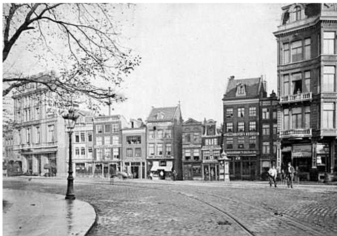
Het Rembrandtplein in 1883, in het midden de ingang van de Bakkerstraat

noordzijde der Botermarkt en vestigde daarin zijn zadelmakerij. De concurrentie liet zich niet afschrikken. In 1738 krijgt Jurrien Schoute een travailje voor zijn huis bij de Reguliersdwaarsstraat tegen f 6 ‘s jaars aan de stadsaalmoezeniers, terwijl op den hoek der Engelsche gang een groote hoefsmidswinkel was met travailjes, fornuis, koelbak, twee blaasbalgen, een bank en een schroef, die in