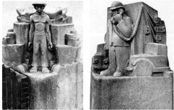
Het Oosten (links) en het Westen (brug Jan van Galenstraat/ Admiraalengracht)

Mendes da Costa verbindt vormvastheid en geslotenheid met expressiviteit en symboliek. Dit ziet men goed in het tegenover de Beurs gelegen gebouw van de Utrechtse Levensverzekeringsmij. Wanneer de jonge kunstenaars zich verzetten tegen de té puriteinse onderdrukking van de eigen creatieve gedachte door de rationele geest van de architect, vinden zij aansluiting bij Mendes. Veel van zijn werk is afgebeeld in Wendingen .