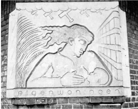
F. Sieger, Zogende Moeder (hoek Haarlemmerweg/ Gibraltarstraat)

Het stadhuis heeft 12 gevelstenen die eigenschappen, wenselijk voor bestuurders, voorstellen. Het geologisch instituut (Nieuwe Prinsengracht 130) heeft voorstellingen van aardbevingen, mijnbouw, vulkanen etc. Krop wordt geïnspireerd door gedichten (Gorters Pan vindt men weerspiegeld op verschillende plaatsen, onder andere het spoorwegviaduct Spaarndammerstraat). Het beeldhouwwerk aan de brug Boerenwetering/Van Hilligaertstraat is geïnspireerd op een gedicht van Van Collem: de kunstenaar die de mens de weg naar de hemel wijst. Het meeste en beste werk loopt parallel met de bloeitijd van de Amsterdamse School; vooral in Krop's werk is er dan sprake van grote levendigheid en afwisseling (karakteristiek is een zekere grimmigheid). In zijn latere werk is er mede door de schaalvergroting vaak sprake van een zekere leegheid.