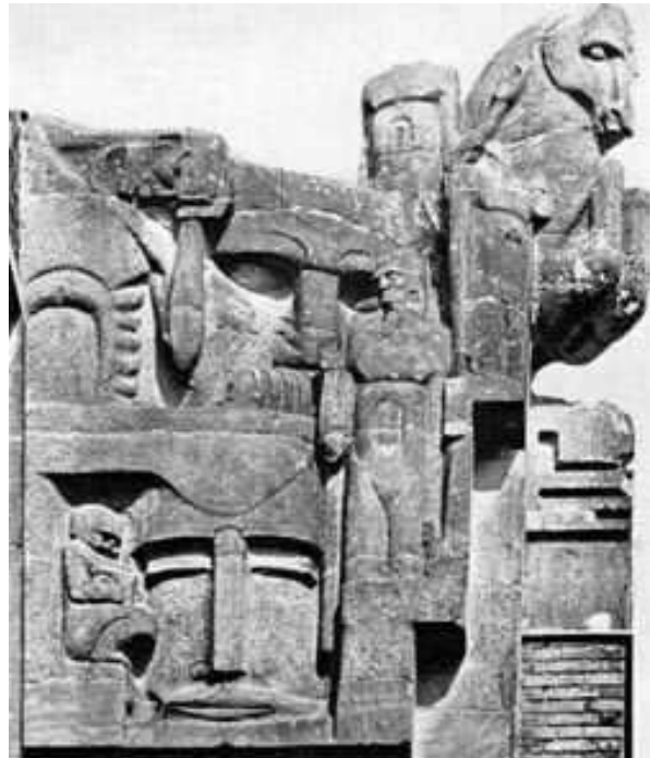
"De geboorte van de Daad", Hildo Krop

Door Wibaut en Hulshoff wordt in Amsterdam de socialistische idee op grote schaal verwezenlijkt.. Hildo Krop wordt benoemd tot stadsbeeldhouwer. In korte tijd wordt de stad verrijkt met een schat aan beeldhouwwerk, een uniek feit in de Nederlandse kunstgeschiedenis. In de thematiek staat de mens, met name de arbeider en de vrouw, centraal.